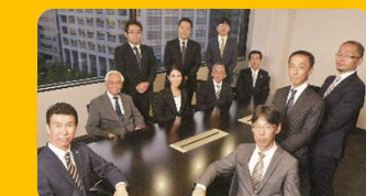
如水グループ (如水監査法人・如水税理士法人・如水 法律事務所・如水社会保険労務士事務所)